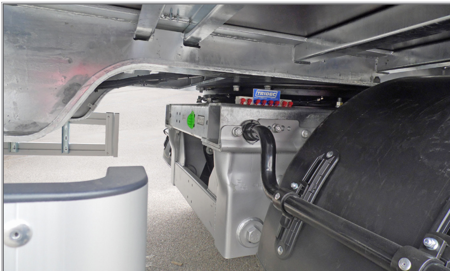
FOTO 11 - Biga a pianale con tetto idraulico sollevabile Flatbed central-axle truck trailer with hydraulic lift-up roof Plattform-Zentralachsanhänger mit hydraulisch anhebbaarem Dach