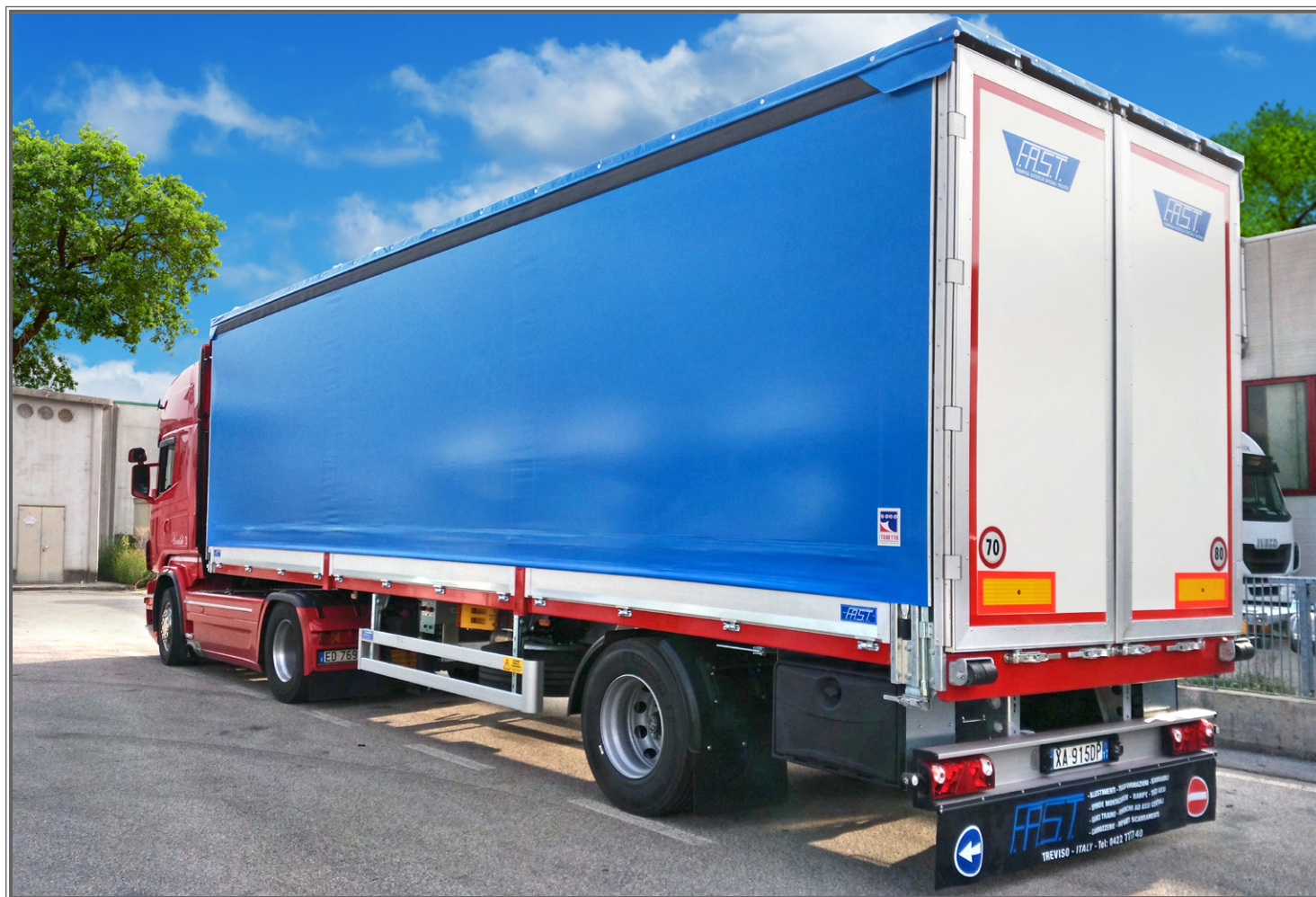
FOTO 01 - Biga a pianale con tetto idraulico sollevabile Flatbed central-axle truck trailer with hydraulic lift-up roof Plattform-Zentralachsanhänger mit hydraulisch anhebbaarem Dach