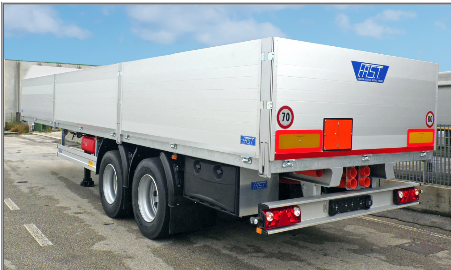
FOTO 05 - Biga a pianale con tetto idraulico sollevabile Flatbed central-axle truck trailer with hydraulic lift-up roof Plattform-Zentralachsanhänger mit hydraulisch anhebbaarem Dach

Tetto idraulico sollevabile Hydraulic lift-up roof hydraulisch anhebbares Dach