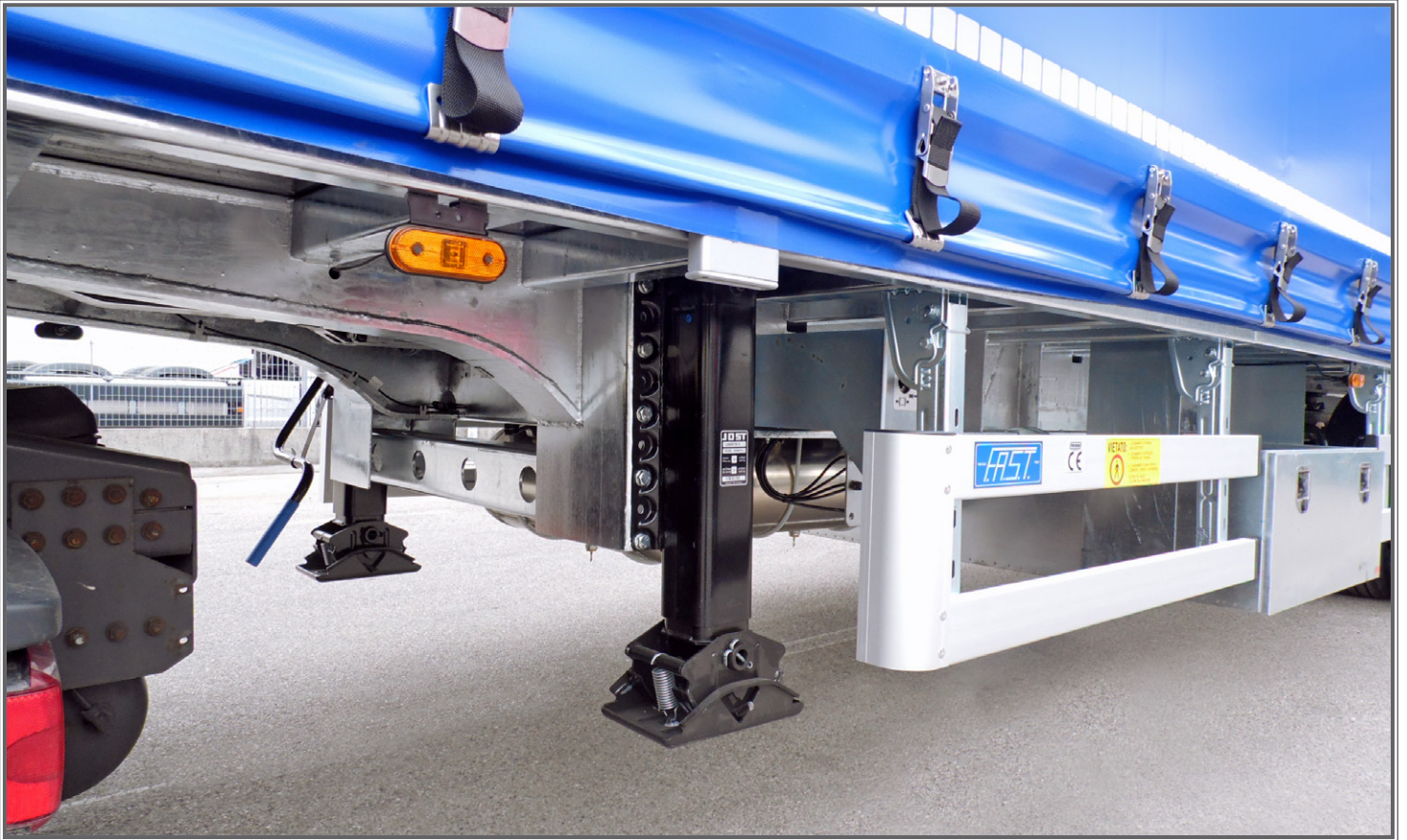
FOTO 12 - Biga a pianale con tetto idraulico sollevabile Flatbed central-axle truck trailer with hydraulic lift-up roof Plattform-Zentralachsanhänger mit hydraulisch anhebbaarem Dach