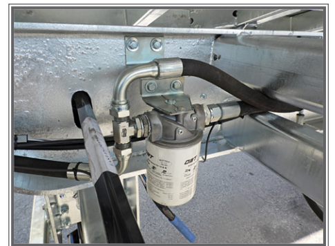
FOTO 09 - Biga a pianale con tetto idraulico Flatbed central-axle truck trailer Plattform-Zentralachsanhänger