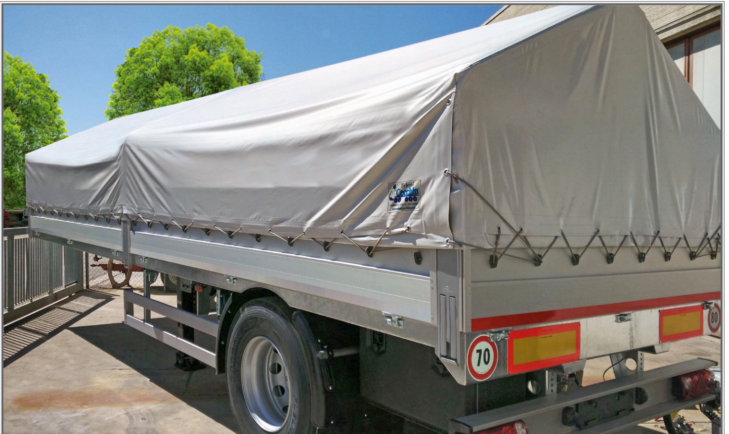
FOTO 13 - Biga a pianale con tetto idraulico sollevabile Flatbed central-axle truck trailer with hydraulic lift-up roof Plattform-Zentralachsanhänger mit hydraulisch anhebbaarem Dach