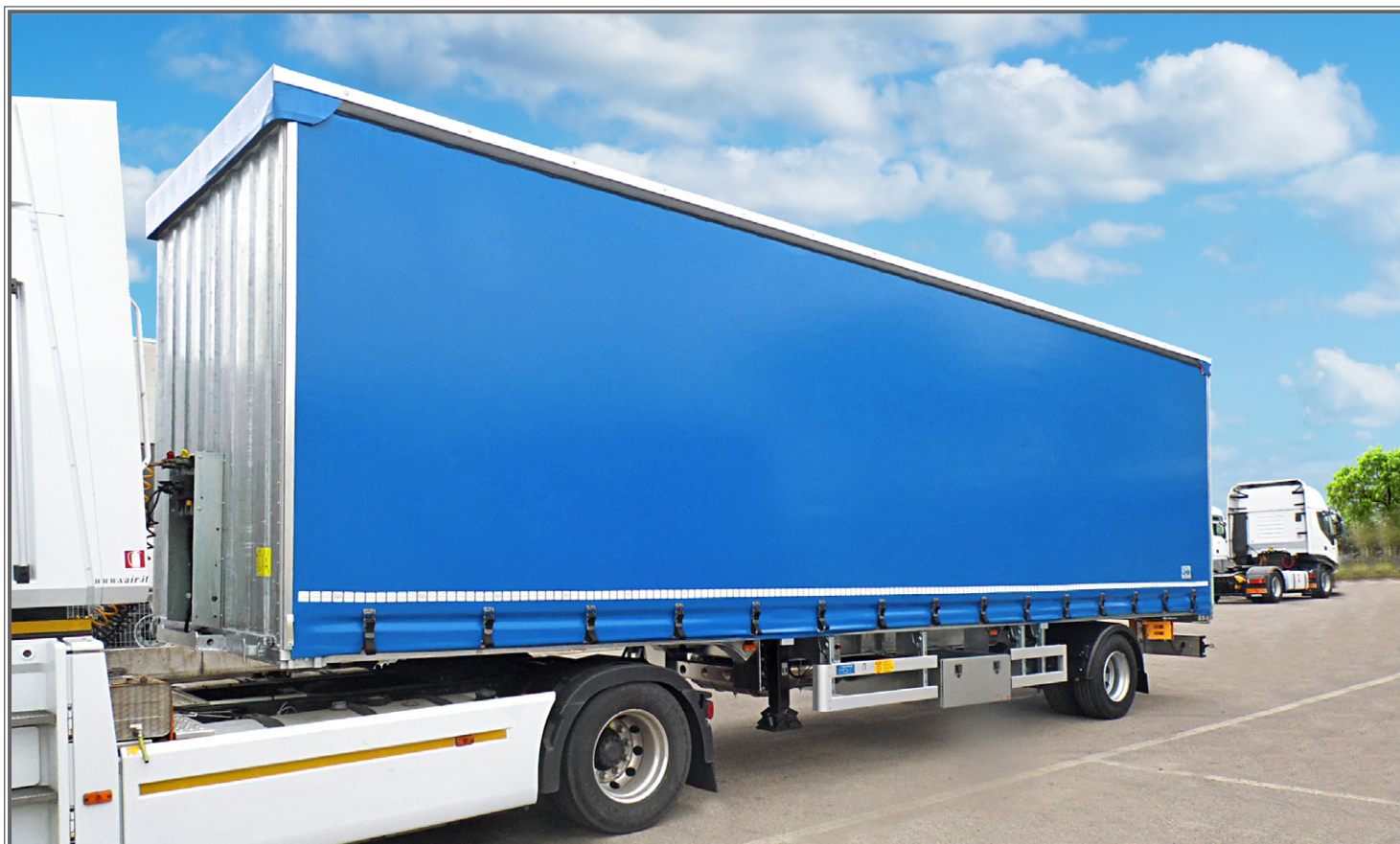
FOTO 10 - Biga a pianale con tetto idraulico sollevabile Flatbed central-axle truck trailer with hydraulic lift-up roof Plattform-Zentralachsanhänger mit hydraulisch anhebbaarem Dach