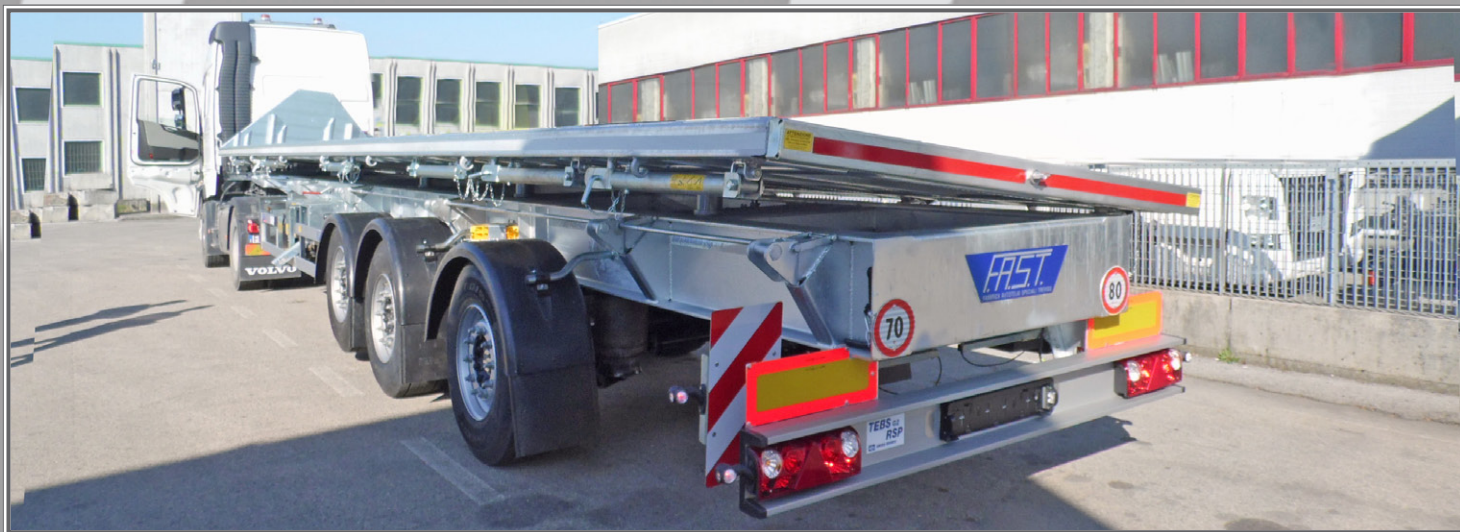
FOTO 13 - Biga a pianale con tetto idraulico sollevabile Flatbed central-axle truck trailer with hydraulic lift-up roof Plattform-Zentralachsenanhänger mit hydraulisch anhebbaarem Dach

Dank der hohen Planungs- und Produktionsflexibilität können technisch innovative Lösungen geboten werden.