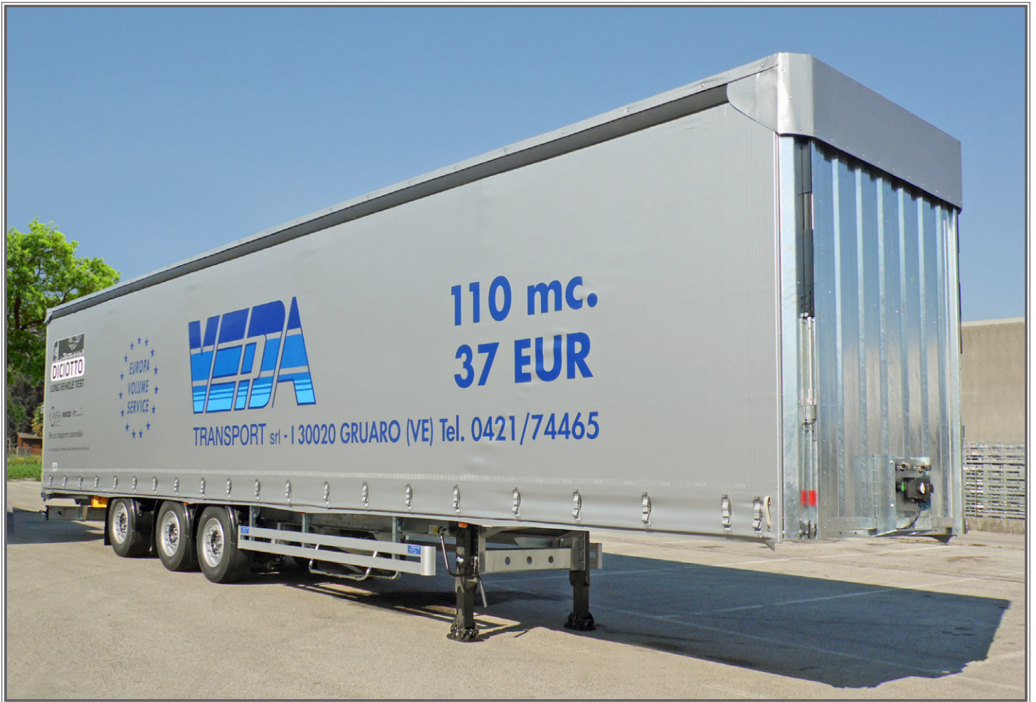
FOTO 02 - Biga a pianale con tetto idraulico sollevabile Flatbed central-axle truck trailer with hydraulic lift-up roof Plattform-Zentralachsanhänger mit hydraulisch anhebbaarem Dach