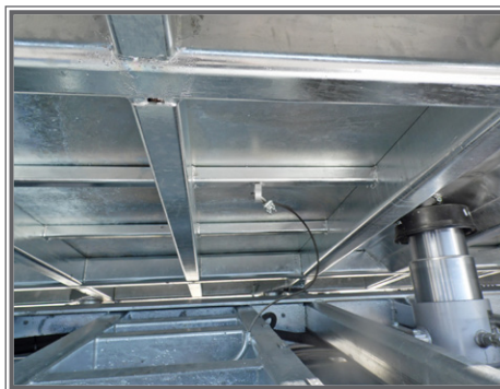
FOTO 08 - Biga a pianale con tetto idraulico Flatbed central-axle truck trailer Plattform-Zentralachsanhänger