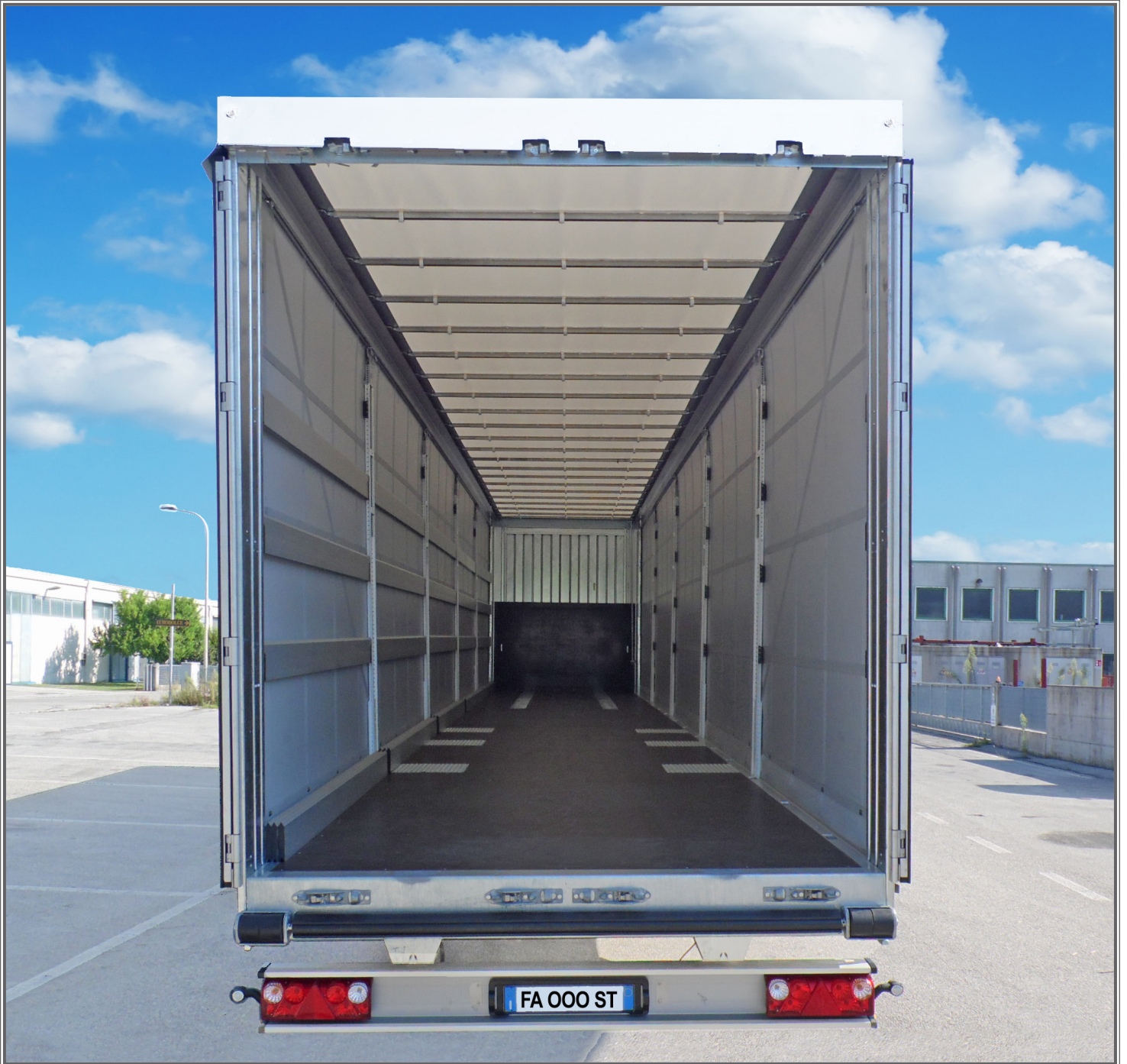
FOTO 06 - Biga a pianale con tetto idraulico sollevabile Flatbed central-axle truck trailer with hydraulic lift-up roof Plattform-Zentralachsanhänger mit hydraulisch anhebbarem Dach