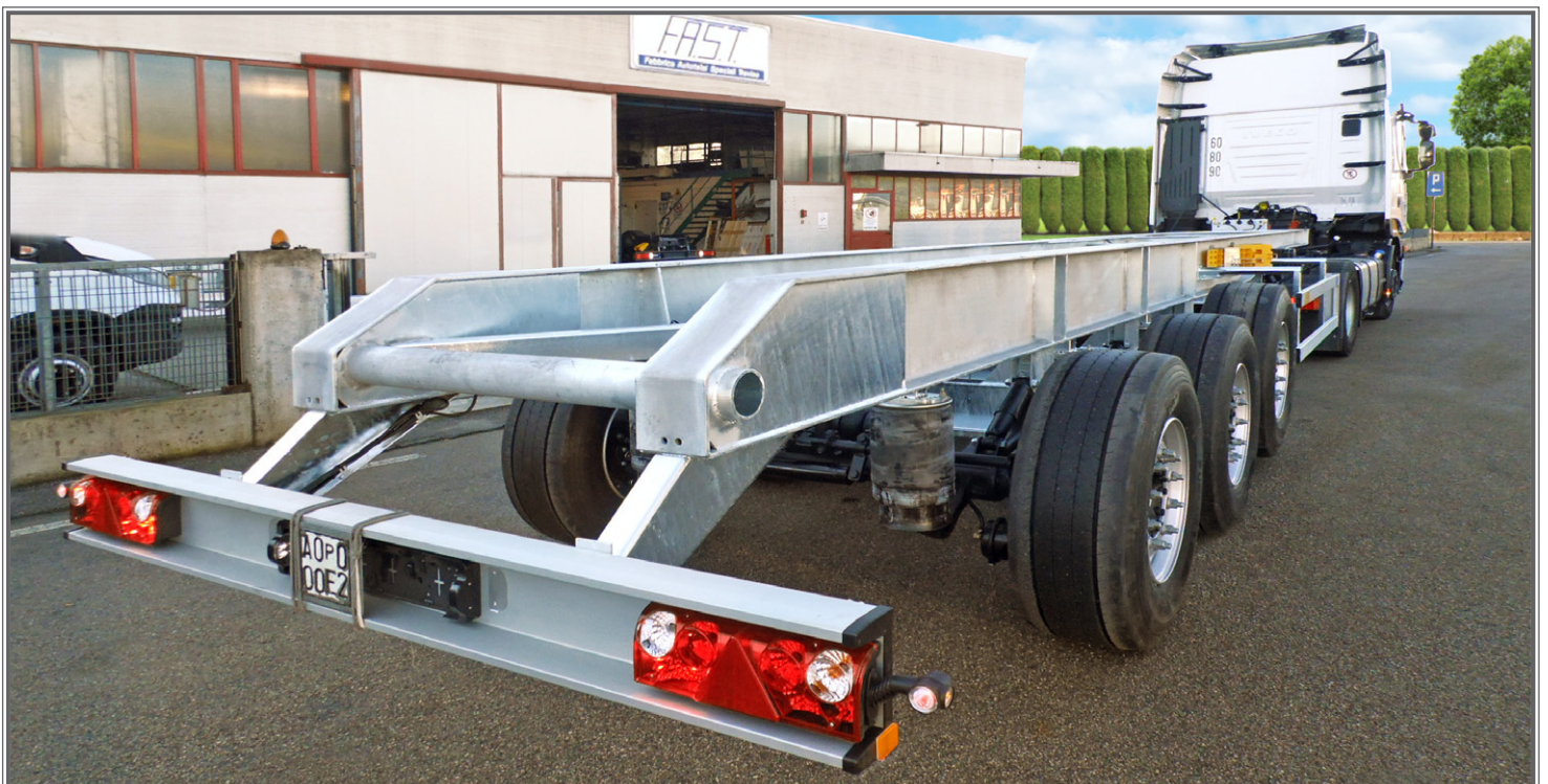
FOTO 03 - Biga a pianale con tetto idraulico sollevabile Flatbed central-axle truck trailer with hydraulic lift-up roof Plattform-Zentralachsanhänger mit hydraulisch anhebbaarem Dach