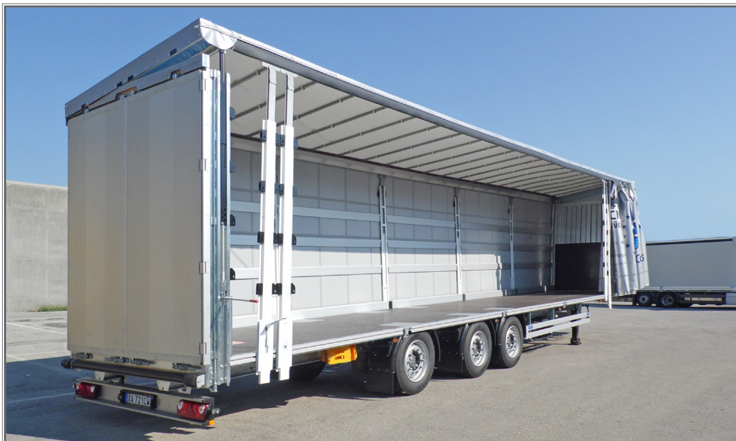
FOTO 04 - Biga a pianale con tetto idraulico sollevabile Flatbed central-axle truck trailer with hydraulic lift-up roof Plattform-Zentralachsanhänger mit hydraulisch anhebbaarem Dach

Tetto idraulico sollevabile Hydraulic lift-up roof hydraulisch anhebbares Dach